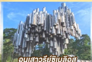
อนุสาวรีย์ซีเบลึอุส