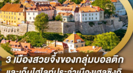
3 เมืองสวยจิ้งของกลุ่มบอลติก และเก็บไฮไลท์ประจำเมืองเฮลซิงกิ และล่องเรือเฟอร์รี่ข้ามประเทศ

ไฮไลท์ในโปรแกรม • เที่ยวสามประเทศหลักกลุ่มบอลติก • ชมเมืองหลวงวิลนิอุส ประเทศลัตเวีย