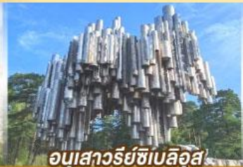
อนุสาวรีย์ซีเบลึส