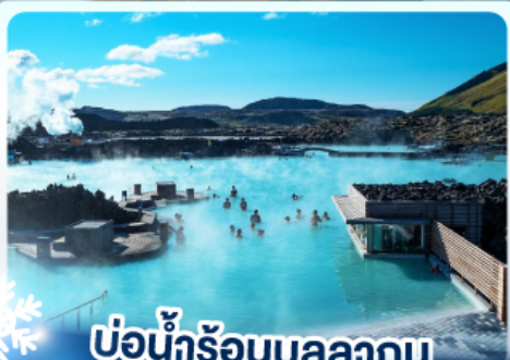
แช่น้ำร้อนบลูลากูน

เก็บไอซ์แลนด์ แดนภูเขาไฟคิรคจูฟล และ แช่น้ำร้อนบลูลากูน