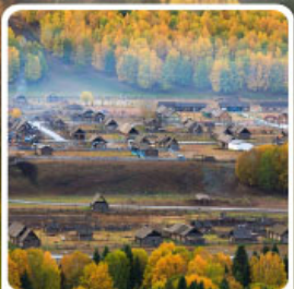
หมู่บ้านห่อมู่

สวรรค์ใบไม้เปลี่ยนสี เยือนคานาสีอแดนฝัน มหัศจรรย์หมู่บ้านห่อมู่ เคอเคอทัวไห่อัศจรรย์ภูผาหิน