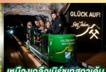
เหมืองเกลือเบิร์ชเทสกาเดิน