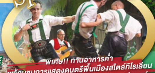
พิเศษ!! ทานอาหารค่ำ พร้อมชมการแสดงดนตรีพื้นเมืองสไตล์โรเลียน และเยือนเมืองอูเทรคต์ สีสันใหม่เนเธอร์แลนด์

ไฮไลท์โปรแกรม • เยือนเมืองแห่งแคว้นบาวาเรีย และ ทิโรล • สุกสนานเหมืองเกลือเบิร์ชเทสกาเดิน • เข้าชมปราสาทนอยชวานสไตน์ • เดินเล่นจัตุรัสโรเมอร์ ซอปปิง Zeil Street • ถ่ายรูปมุมสวยของหมู่บ้านอัลสติก • ซิลลา ไปในเมืองซาลสบูร์ก บ้านเกิดโมสาร์ท • ล่องเรือหมู่บ้านทีธูร์น และ ล่องเรือชมนครอัมสเตอร์ดัม • ซอปปิงจุ้ย่านดิมสแควร์และเดินเล่นย่านโคมแดง 25 ก.ย. - 04 ต.ค. 69 09-18, 16-25 ต.ค. 69 22-31 ต.ค. 69 / 06-15 พ.ย. 69 29 ธ.ค. 69 - 07 ม.ค. 70 * ปีใหม่ *