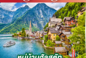
หมู่บ้านอัลสติก