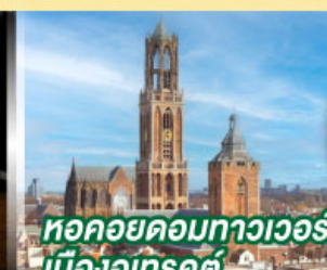
หอคอยคองทาวเวอร์ เมืองอูเทรคต์