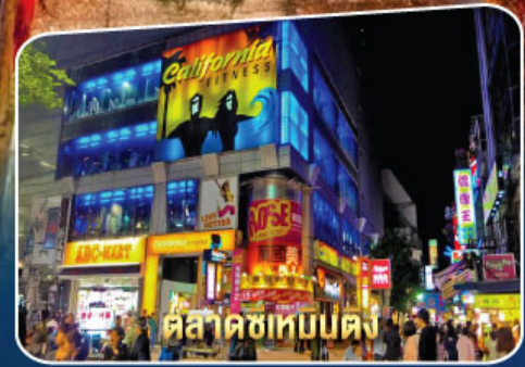
ตลาดซีเหมินตง

เมนูพิเศษ ! Buffet Shabu, Taiwan Seafood