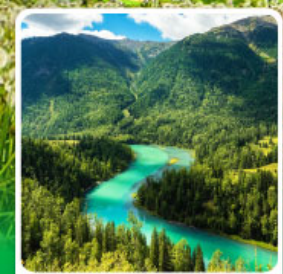
ทะเลสาบคานาสือ