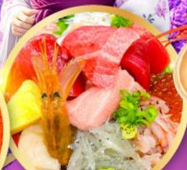
ตลาดปลาชิบิสึ คาชิโนะอิจิ