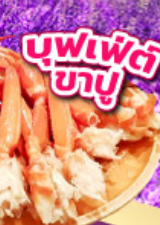
บุฟเฟ่ต์ ชาบู