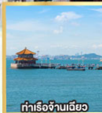
ทำเรือจ้านเฉียว