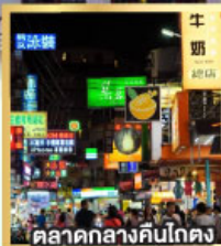
ตลาดกลางคืนโตง