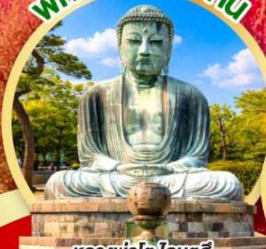
หลวงพ่อดโต โดบุตสึ