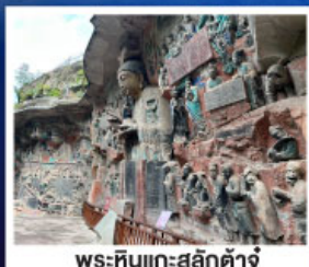
พระหินแกะสลักตัวจู้