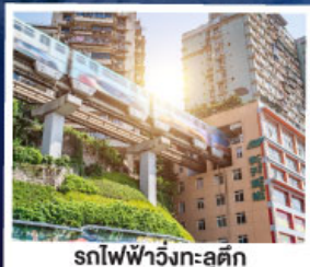
รถไฟฟ้าวิ่งทะลุศึก