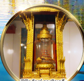
พิพิธภัณฑ์ กรุงนิวเดลี กราบนมัสการพระบรมสารีริกธาตุ