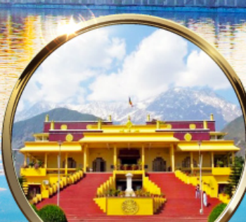
ดาริมซาล่า "ธรรมศาลา" ตำหนักองค์ดาโลลามะ