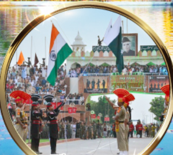
พิธีลดธงชาติ อินเดีย-ปากีสถาน ด้านวากาห์