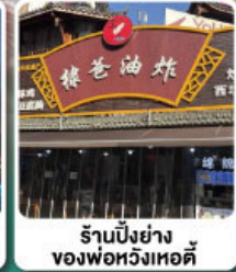
ร้านปังย่าง ของพ่อหึงหอดี้