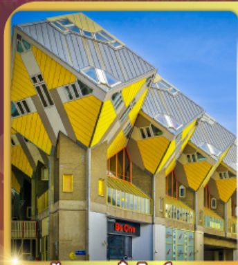
บ้านลูกเต่า โลกคู่บูส

“ล่องเรือหลังคากระจก” ชมกรุงอัมสเตอร์ดัม