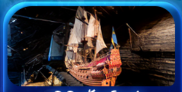
พิพิธภัณฑ์ทิวาชา