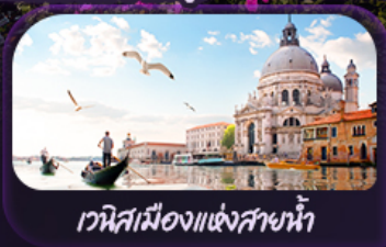
เวนิสเมืองแห่งสายน้ำ