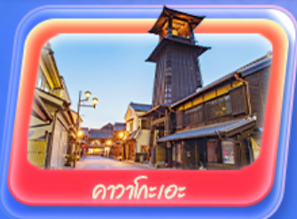
คาวาโกะเอะ