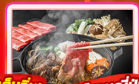
เต็มอิ่ม! บุฟเฟ่ต์ซาบูกุญี่ปุ่น