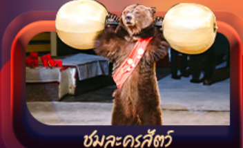
หมีเคดร์สกี