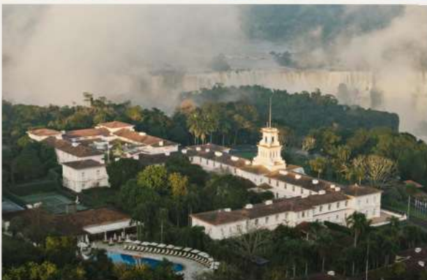
Hotel das Cataratas, A Belmond Hotel