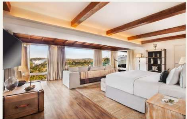
Gran Meliá Iguazú Argentina Side