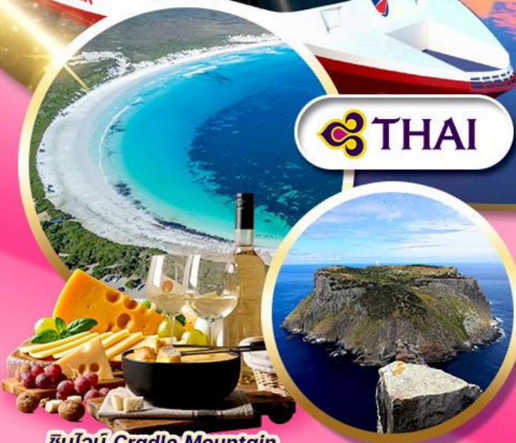
ซิมูน Cradle Mountain