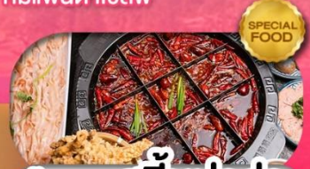
มือพิเศษ สุกี้หม่าล่า