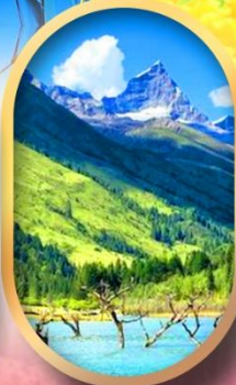
อุทยานสีดรุณี