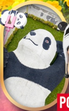
หมีแพนด้าเซลฟี