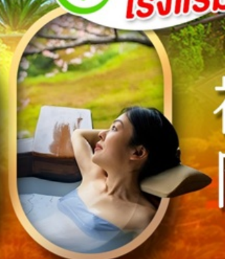
แช่บ่อนอนเซ็นญี่ปุ่น