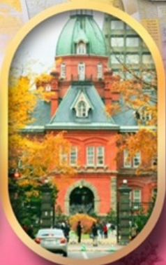
ศาลาว่าการเก่า