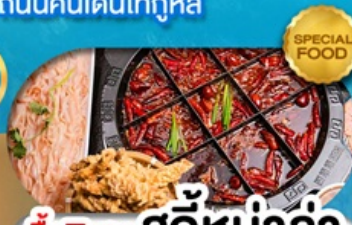
มือพิเศษ สุกี้หม่าล่า