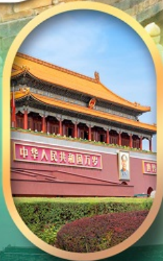
จัสมตรีสเทียนอันเหมิน