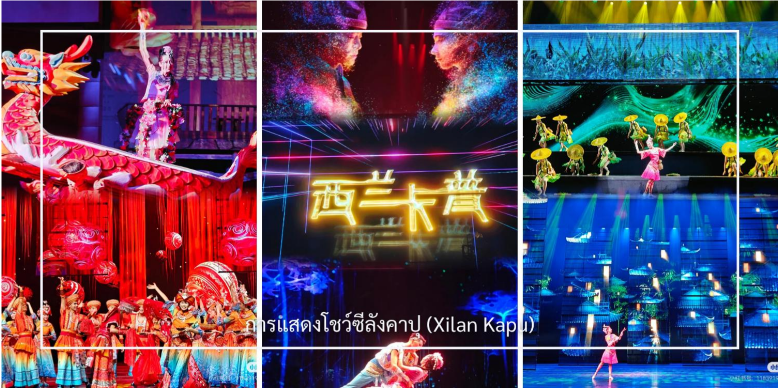
การแสดงโชว์ซีลิ่งคาปู (Xilan Kapu)

จากนั้นนำท่านรับชมการแสดงวัฒนธรรมพื้นบ้าน “ซีลิ่งคาปู” อันเป็นศิลปะการแสดงที่สะท้อนอัตลักษณ์และภูมิปัญญาท้องถิ่นได้อย่างลึกซึ้ง การแสดงถ่ายทอดเรื่องราวของวิถีชีวิต ความเชื่อ และขนบธรรมเนียมประเพณีของชุมชน ผ่านท่วงท่าการรำร่าที่อ่อนช้อย ผสานกับเสียงดนตรีพื้นเมืองที่มีเอกลักษณ์เฉพาะตัว พร้อมเครื่องแต่งกายสีสันงดงามที่บ่งบอกถึงรากเหง้าทางวัฒนธรรม