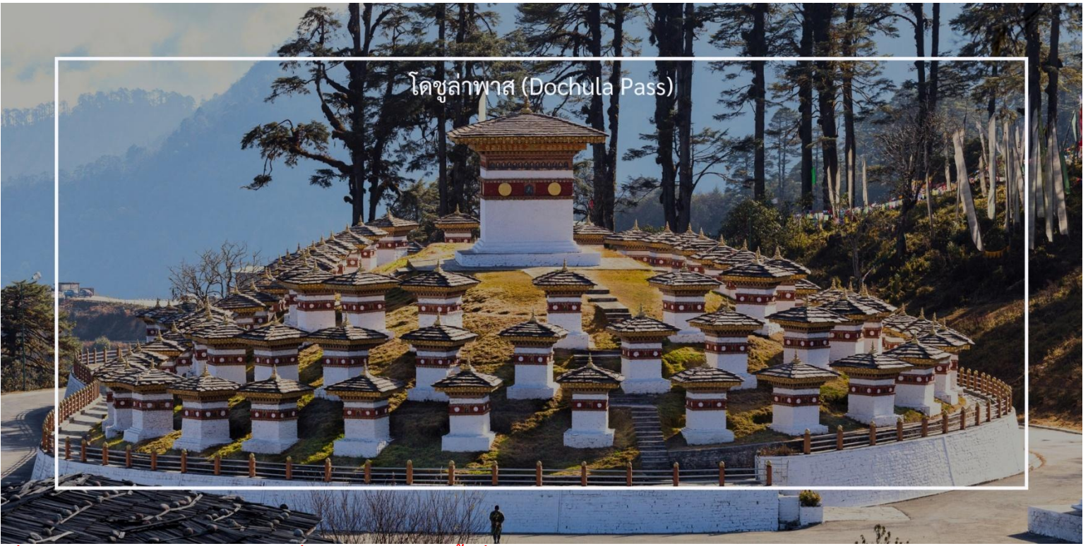
โดชูลาพาส (Dochula Pass)