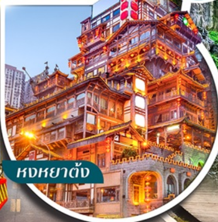
หงหยาดั่ง