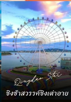
Qingdao Star ชิงช้าสวรรค์ชิงเต่าอาย