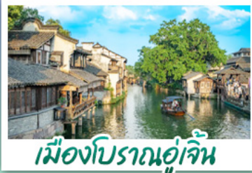
เมืองโบราณอู๋เจิน