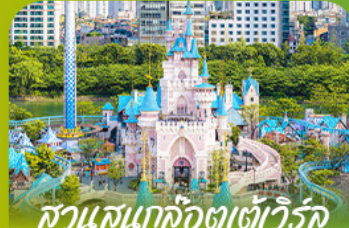
สวนสนุกโลกอเวอเวิร์ค Lotte 'adventure world