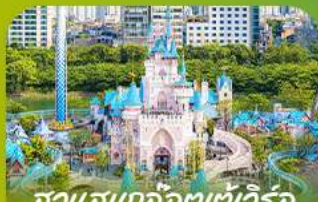
สวนสนุกโลกเตเวอริล Lotte Adventure World