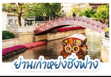
ย่านเก่าเซ่งซังฟาง