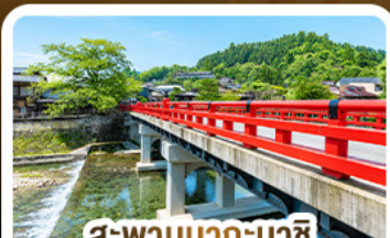
สะพานนากะบาชิ ทาดายาม่า