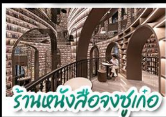
ร้านหนังสือจชช.เก๋อ

อุทยานสัตว์ดรุณี - อุทยานป่าน้ำทิพย์ - วัดต้าฉือ หมีแพนด้าบนเนินเขา - ร้านหนังสือจชช.เก๋อ ถนนโบราณชอยกวางชอยแคบ ช้อปปิงถนนไท่กู่หลี่ + ถนนชุนชู่ CHENGDU TIMES OUTLETS