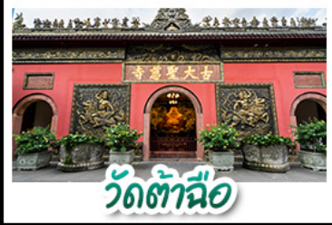
วัดต้าจื่อ