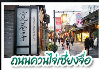
ถนนคาน่าจี้เซียงจื่อ