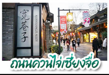
ถนนควนไจ่เซียงจื่อ