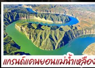
แกรนด์แคนยอนแม่น้ำเหลือง