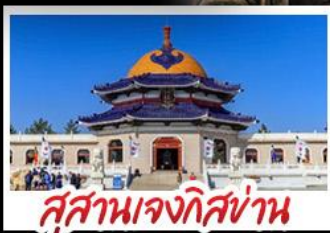
สุสานเจกิสข่าน