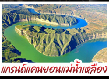
แกรนด์แคนยอนแม่น้ำเหลือง