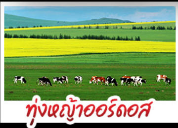
ทุ่งหญ้าเออร์ดอส

ทุ่งหญ้าเออร์ดอส สุสานเจงกิสข่าน แกรนด์แคนยอนแม่น้ำเหลือง