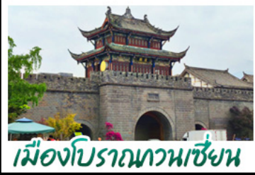
เมืองโบราณทวนเซี่ยน

ภูเขาสู่ลู่หนี่ - อุทยานนี้ผิงโกว - สะพานหนานเฉียว ร้านหนังสือจงซูเก้อ - เมืองโบราณกวนเสียน จตุรัสหย่างเทียนหู่ - หมีแพนด้าเซลฟี่ ถนนโบราณชอยว้างชอยแคบ - ถนนคนเดินไท่กู่หลี่ ถนนคนเดินซุนซี - ถนนโบราณจิ้นหลี่ แพนด้ายักษ์ปีนตึก - น้ำพุไม้ไผ่ตึกSKP - วัดต้าอื่อ