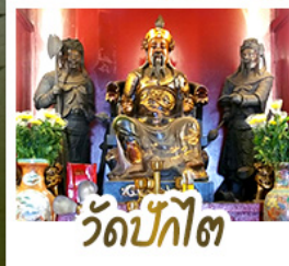
วัดป้กั๊ต