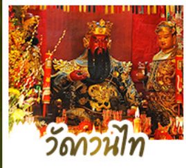
วัดกวนน้้ท