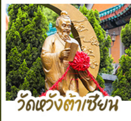
วัดเขวังต้าเซียงน