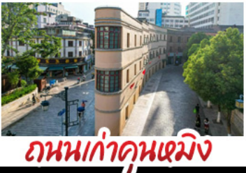
ถนนเก่าคุณเหมิง

27 ต.ค. - 01 พ.ย.69 ราคา 29,900 | 28 ต.ค. - 02 พ.ย.69 ราคา 29,900 | 29 ต.ค. - 03 พ.ย.69 ราคา 29,900 30 ต.ค. - 04 พ.ย.69 ราคา 29,900 | 31 ต.ค. - 05 พ.ย.69 ราคา 29,900