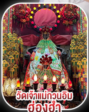
เจ้าแม่กวนอิม ฮ่องฮ่า