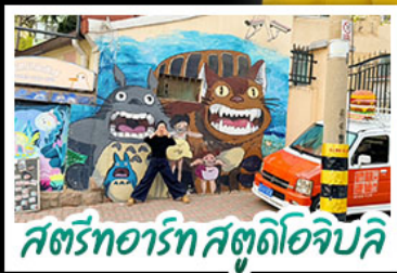
สตรีทอาร์ต สตุตไอจิบลิ