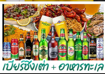
เบียร์ซิงเต่า + อาหารทะเล