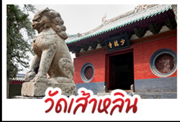
วัดส้าหลิน