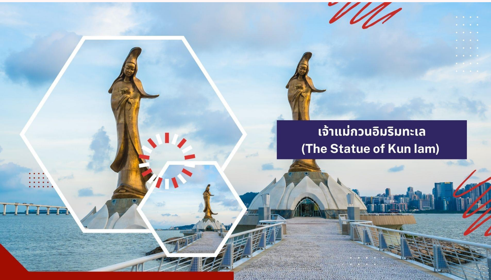
เจ้าแม่กวนอิมริมทะเล (The Statue of Kun lam)

นำท่านชม เจ้าแม่กวนอิมริมทะเล (The Statue of Kun lam) เจ้าแม่กวนอิมปรารงค์ทองสร้างด้วยทองสัมฤทธิ์ทั้งองค์ มีความสูง 18 เมตร หนักกว่า 1.8 ตัน ประดิษฐานอยู่บนฐานดอกบัวดูงดงามอ่อนช้อย สะท้อนกับแดดเป็นประกายเรืองรองเหลืองอร่ามงดงาม จับตา เจ้าแม่กวนอิมองค์นี้เป็นเจ้าแม่กวนอิมลูกครึ่ง คือ ปั้นเป็นองค์เจ้าแม่กวนอิมแต่กลับมีพระพักตร์เป็นหน้าพระแม่มาลีที่เป็นเช่นนี้ก็เพราะว่าเป็นเจ้าแม่กวนอิมโปตุเกสตั้งใจสร้างขึ้นเพื่อเป็นอนุสรณ์ให้กับมาเก๊าในโอกาสที่ส่งมอบมาเก๊าคืนให้กับจีน