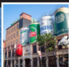
โรงเบียร์เยอรมัน