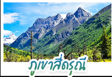
ภูเขาสู่ดรุณี