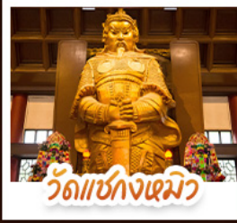
วัดเซ่งเจง