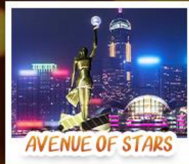
AVENUE OF STARS