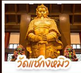
วัดเซ่งโง้ว