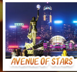
AVENUE OF STARS