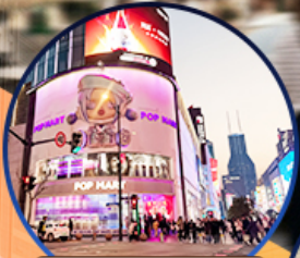
ถนนนานจิง

เที่ยวครบไฮไลท์ ช้อปปิ้งจุใจ อิสระฟรีเดย์ 1 วัน