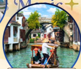
เมืองโบราณจูเจียเจีย