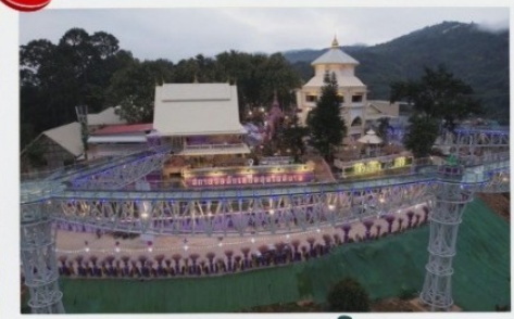
สกายวอล์ค

2 ท่านขึ้นไป 14,499 บาท/ท่าน 4 ท่านขึ้นไป 12,799 บาท/ท่าน 6 ท่านขึ้นไป