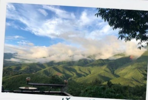
หมู่บ้านสะปัน