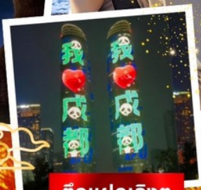
ตึกแฝดเจียงตู