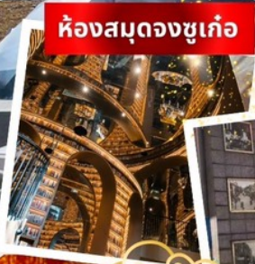
ห้องสมุดจงซูเก้อ